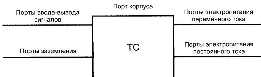
Рисунок 1 — Примеры портов ТС